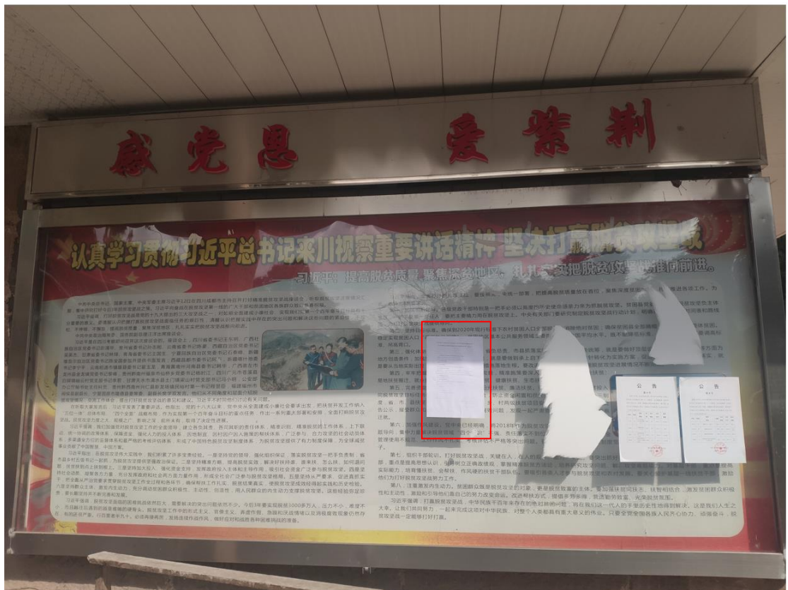
图7 现场张贴公示公告照片——通江县兴隆镇紫荆村委