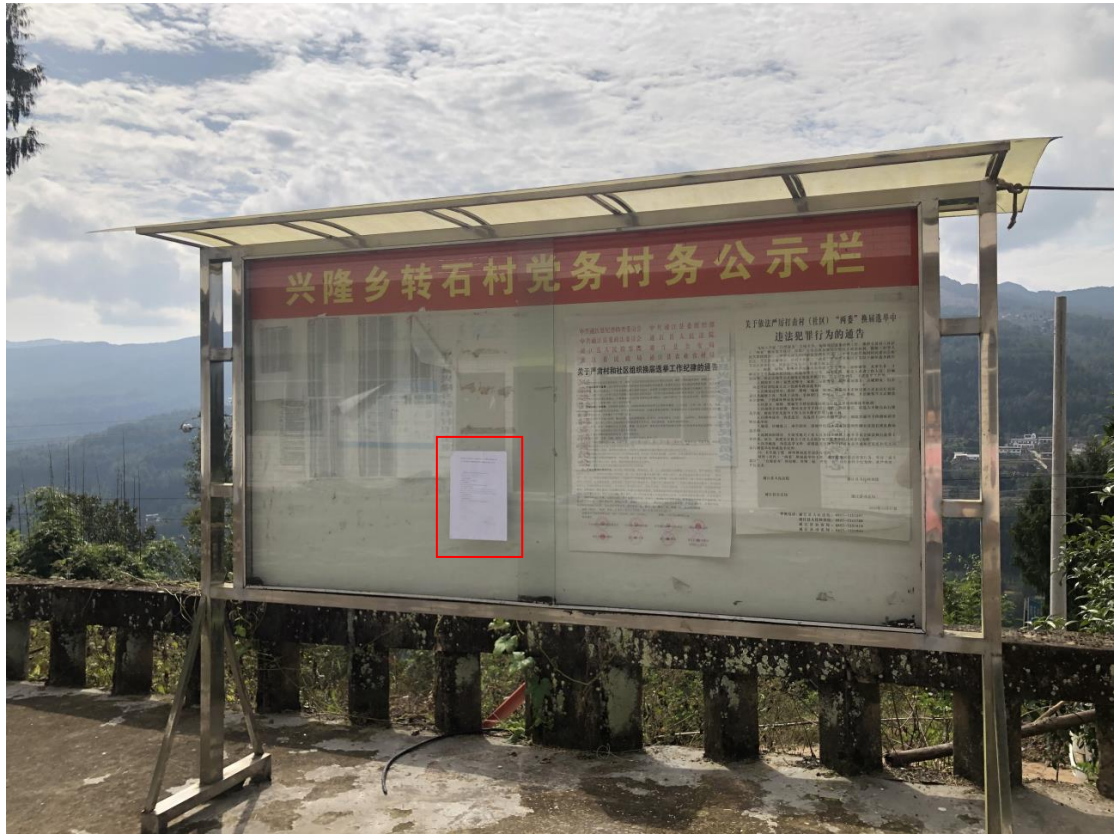
图6 现场张贴公示公告照片——通江县兴隆镇转石村村委会