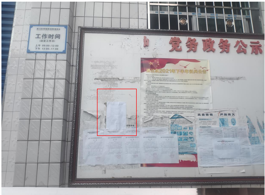
图9 现场张贴公示公告照片——原草池乡政府（现活水沟村村委）