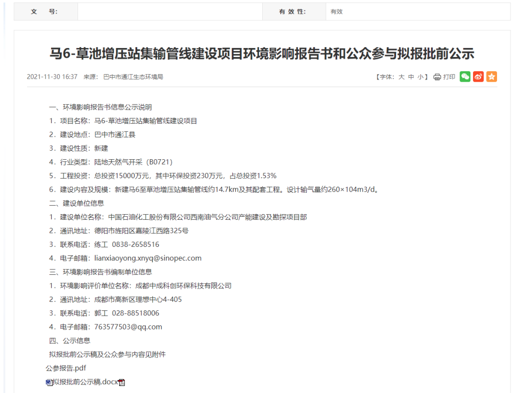
图16 报批前公示截图