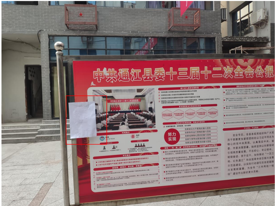
图10 现场张贴公示公告照片——通江县诺江镇政府