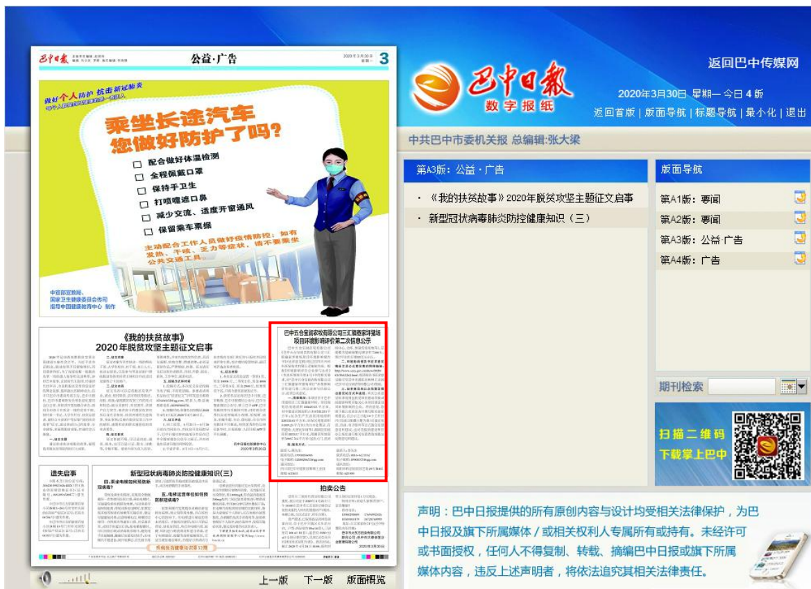
图 3.2-4 第二次报纸公示截图