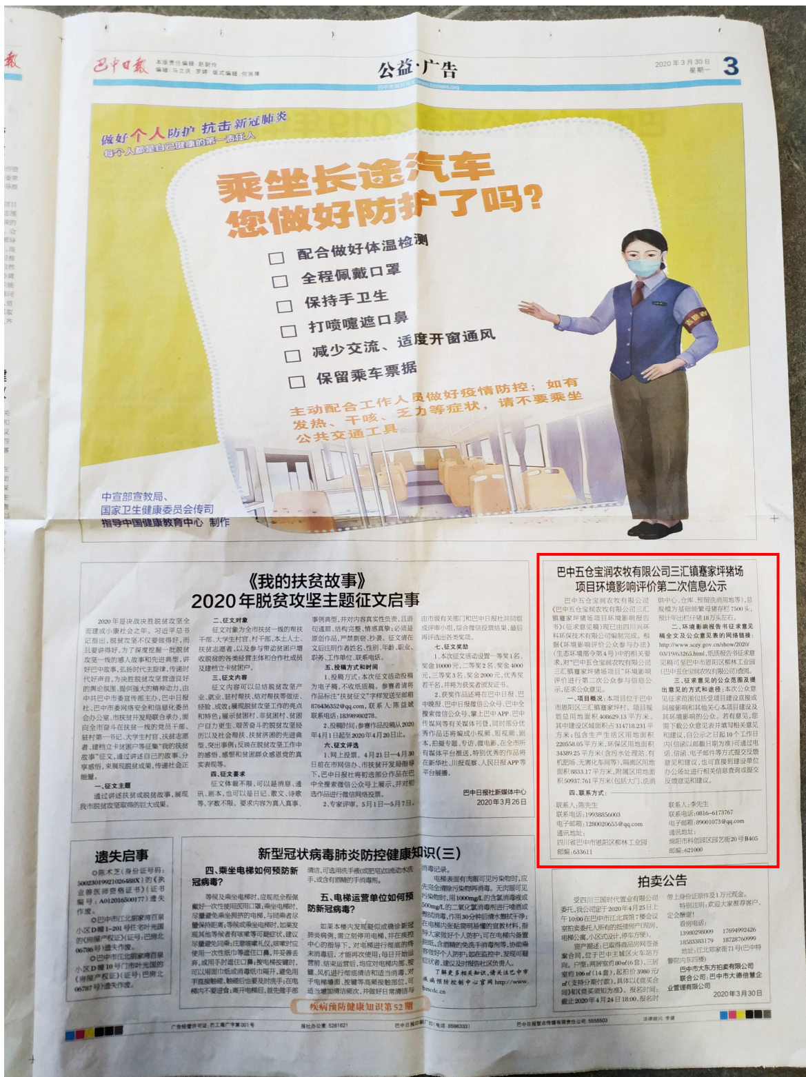
图 3.2-5 第二次报纸公示照片