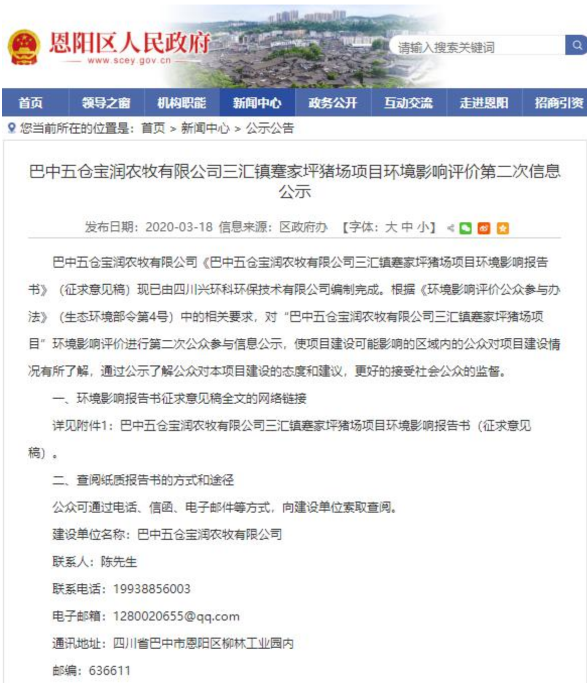
图 3.2-1 环境影响评价第二次网上信息公示截图