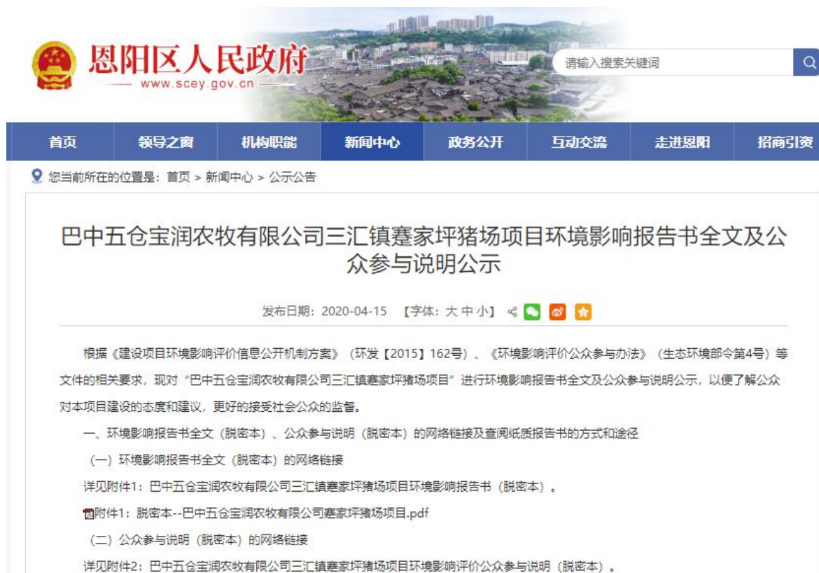
图 4.2-1 环境影响评价第三次网上信息公示截图

建设单位于2020年4月15日~4月21日在恩阳区人民政府门户网站（ http://www.scey.gov.cn/xwzx/gsgg/10537291.html ）进行了第三次网上信息公示（报批前公示），网上公示截图见图6.2-1。