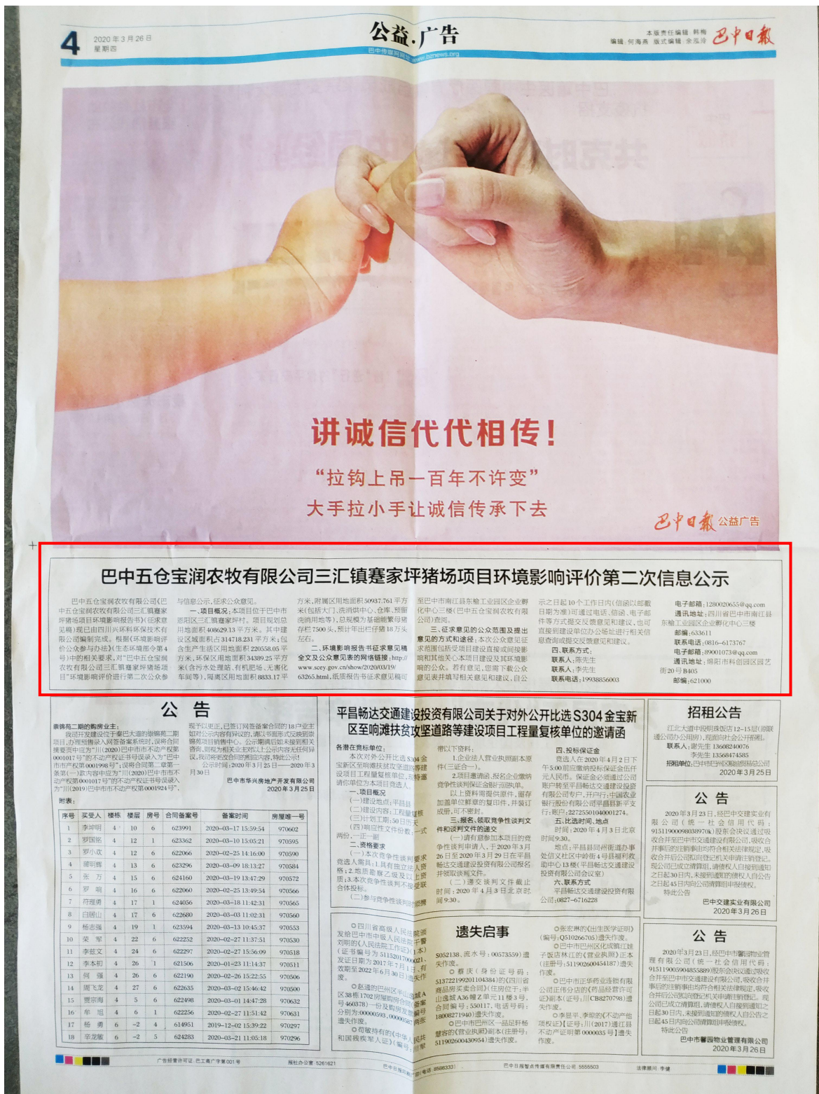
图 3.2-3 第一次报纸公示照片