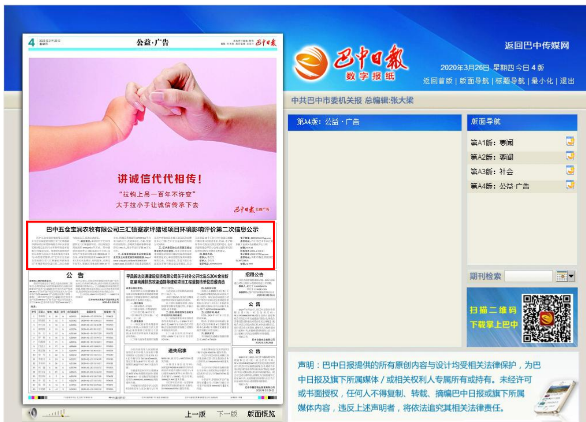
图 3.2-2 第一次报纸公示截图

项目于环境影响报告书征求意见稿网络公示期间分别于2020年3月26日、3月30日在巴中日报进行了两次登报公示，登报公示截图及照片见图3.2-2~图3.2-5。